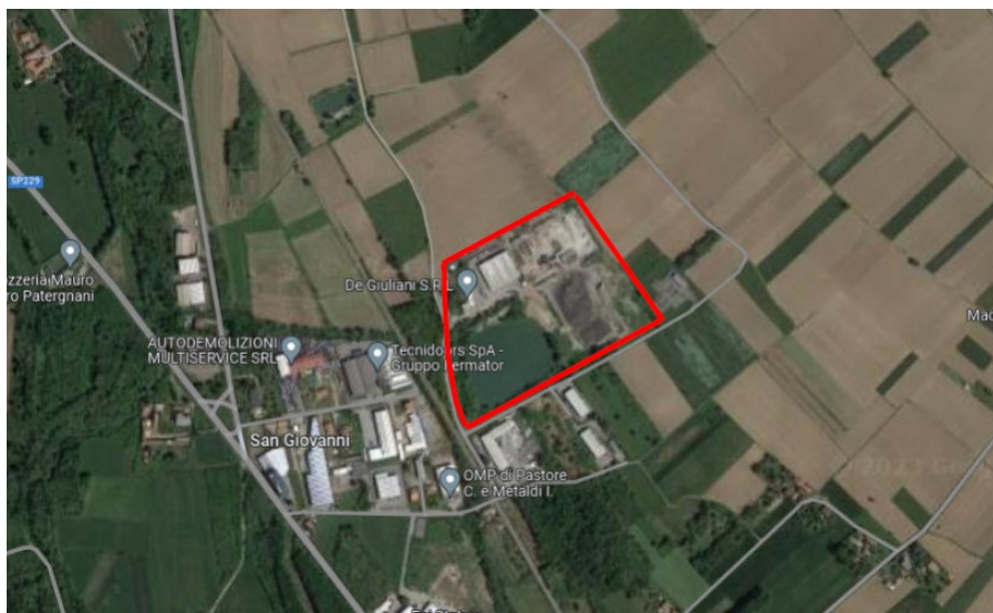
Figura 1: Inquadramento territoriale (Studio Preliminare Ambientale, pag. 7)

I recettori più prossimi sono attività artigianali, dislocate in un raggio di circa 350m a sud dell’impianto stesso.